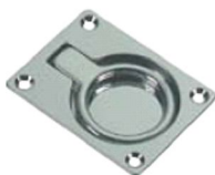
50.50163 mm. 63x48