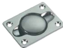
50.50165 a bottone con guarnizione antivibrante mm. 65x48.