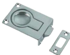
50.50157 Scrocchetto a filo con molla mm. 57x40.