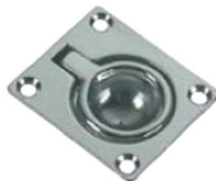
50.50144 mm. 44x38