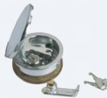
Chiusura boccaporto con tavella a tiraggio regolabile a chiusura stagna 50.50118 con serratura 50.50119 senza serratura