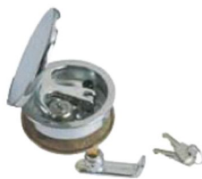
Chiusura boccaporto a filo in ottone cromato con tavella regolabile, Ø esterno mm. 84, Ø incasso mm. 68. 50.50123 con serratura 50.50123S senza serratura