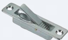
50.50185 Alzapagliolo a ribalta mm. 85x25.