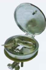
50.50126 Ø esterno mm. 115, Ø incasso mm. 100.