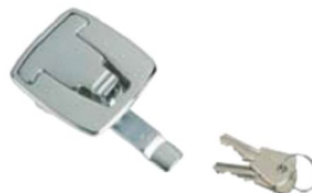
Alzapagliolo a filo in ottone cromato, fissaggio con prigionieri, tavella regolabile da mm. 8 a mm. 20. Dimensioni mm. 53x60 50.50124 con serratura 50.50125 senza serratura