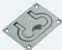
50.50175 mm. 75x55