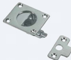
50.50145 Alzapagliolo e ferma porta a scatto con piastrina, mm. 45x42, piastrina mm. 20x42.